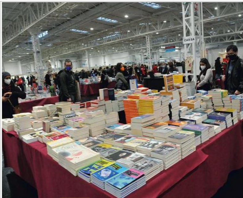
Bookcity, torna la grande rassegna letteraria